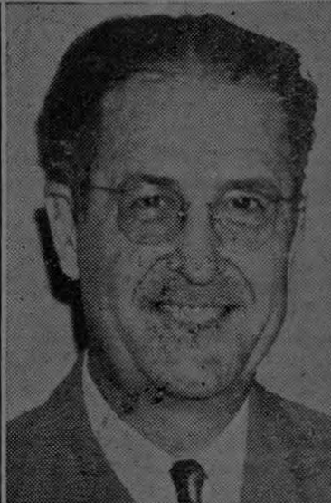
Clinton P. Anderson

WASHINGTON. — Hace varios días, el Presidente Harry S. Truman hizo tres cambios importantes en su gabinete: las primeras medidas de considerable trascendencia tomadas en la reorganización de la familia oficial que recibió como legado del extinto Presidente Roosevelt. Las alteraciones no surtirán efecto sobre las normas de política exterior, ni tampoco sobre la prosecución de la guerra; pero se consideran significativas en cuanto a la transición de la economía motivada por la conflagración mundial a la que ha de prevalecer en épocas de paz. Los cambios abarcan los puestos de procurador general, secretario del trabajo y secretario de agricultura. Anteriormente, el primer magistrado había dado a conocer un cambio en la cartera del administrador de correos. En las esferas oficiales de Washington se observa la costumbre tradicional de que todos los miembros del gabinete y varios otros funcionarios importantes del gobierno sometan su dimisión al nuevo presidente, cada vez que hay un cambio en la presidencia. Esto se hace con el fin de que el nuevo primer magistrado pueda quedar en entera libertad de acción para elegir las personas que han de llevar a la práctica las normas orientadoras de su administración. Siguiendo esa costumbre, al Presidente Truman se le